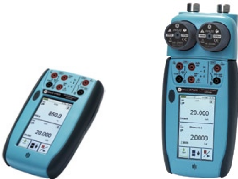
测量、输出 mA、mV、V、电阻、频率、热电阻和热电偶

先进模块化校验系统 AMC 仅使用 3 个基本部件，提供了原先需要使用多种不同仪表才能实现的复杂功能。集世界级的压力校验仪，多功能过程信号校验仪于一体的模块化便携式校验系统。