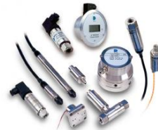
压力传感器/变送器