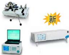
活塞式压力计/压力控制器