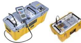
航空航天测量产品

中文网址: http://www.gesensing.com.cn 英文网址: http://www.gesensing.com