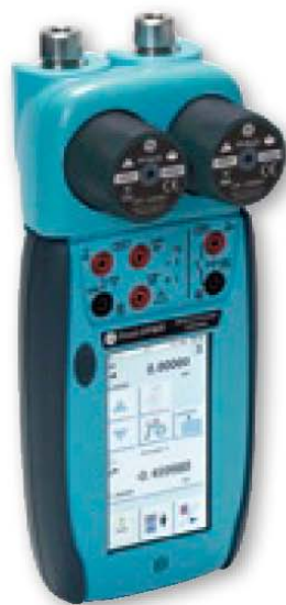
DPI 620 + MC 620 + PM 620

量程范围从 2.5 kPa ~ 100 MPa (10 inH 2 O ~ 15000 psi)，总体不确定度包含 1 年稳定性，0 ~ 50°C (32 ~ 122°F) 温度补偿。