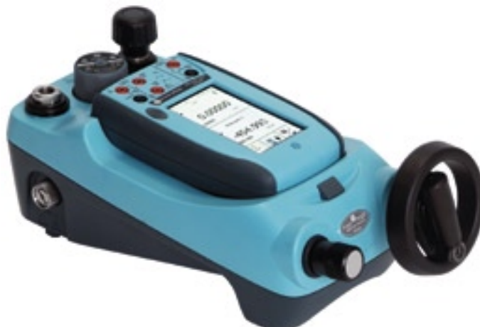
可换量程自产生压力校验仪，量程从 2.5 kPa ~ 100 MPa